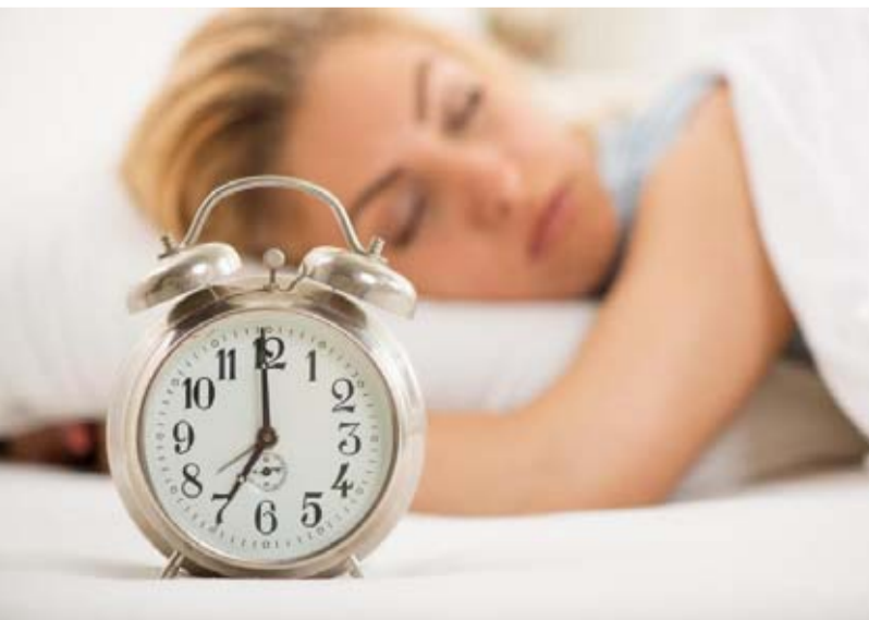
constatées chez l'animal incitent à la plus grande prudence si on envisage d'utiliser de la mélatonine pendant la grossesse. Prescrire conclut : 'Dans tous les cas, quel que soit son statut, la mélatonine n'est pas une substance anodine. Son efficacité est incertaine pour favoriser le sommeil et elle expose à des effets indésirables notables'.

risque d'effets indésirables n'est pas négligeable. Il s'agit de troubles neuropsychiques (syncope, somnolence, mal de tête, convulsions, anxiété, trouble dépressif), de problèmes de peau (éruptions) et de troubles digestifs (vomissements, constipation, atteinte du pancréas). Des troubles du rythme cardiaque, régressant à l'arrêt de la mélatonine, ont été observés, ajoute Prescrire.